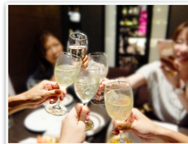
懇親会・その他イベント