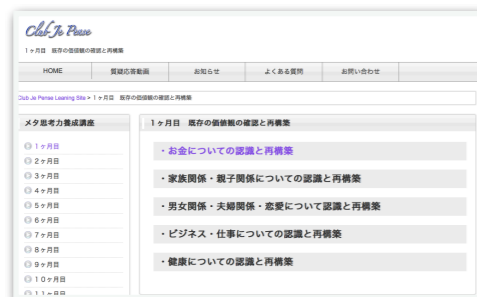
Eラーニングサイト