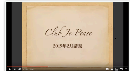
特別講義動画配信